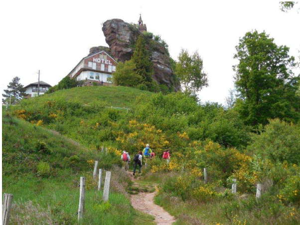
Aufstieg zum Schlossberg mit Felsenkirche