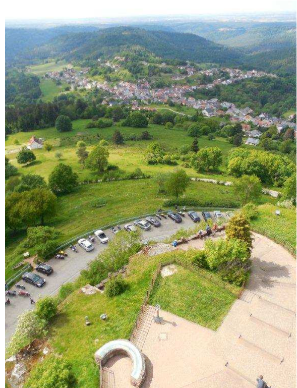
Dabo mit dem Grand Ballerstein im Hintergrund