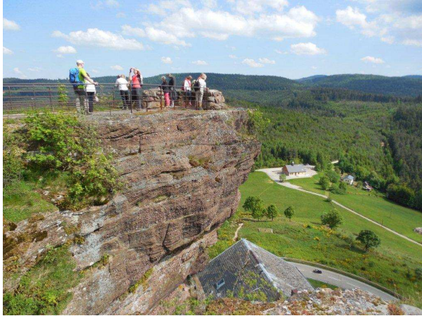
Wanderung durch die Geisterfelsen am Nachmittag.