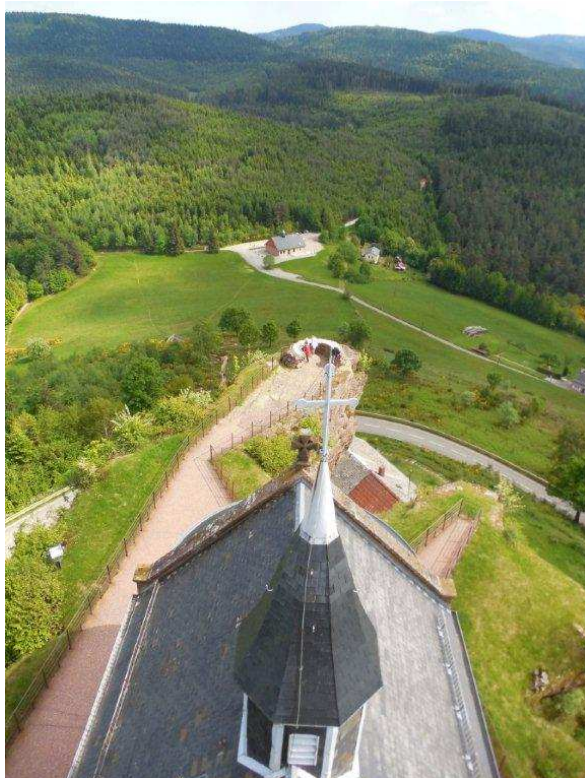
Blick von der Felsenkirche zum ehemaligen Le Chat Noir und Col de la Schleif