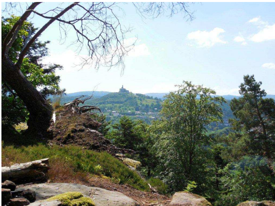
Blick vom Sickertkopf auf den Schlossberg von Dabo