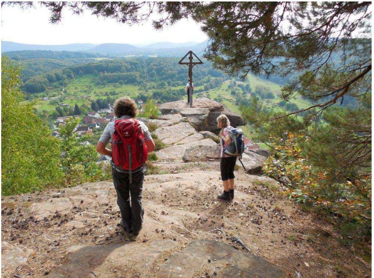
Wachtfelsen über Wernersberg