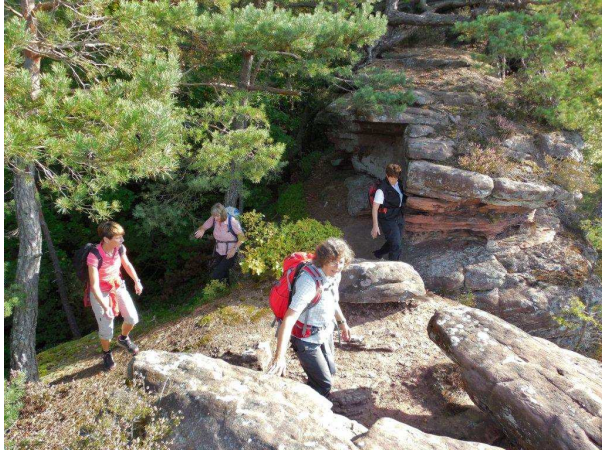
Auf dem Raufelspfeiler